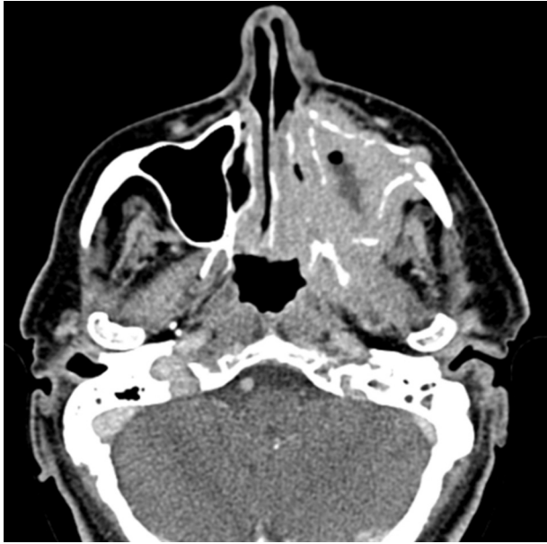
Figura 1 Tomografía computada con algoritmo de partes blandas y contraste intravenoso: se observa una lesión centrada en el seno maxilar izquierdo que produce destrucción ósea y extensión hacia el espacio masticatorio y la nasofaringe.