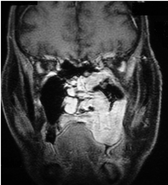
Figura 2 Resonancia magnética, plano coronal, en ponderación T1 con supresión de grasa y gadolinio muestra artefactos por movimientos. Se aprecia la lesión centrada en el maxilar superior izquierdo con extensión a la nasofaringe, orofaringe y suelo orbitario izquierdos.

adenoide quístico reporta un peor pronóstico debido a que se disemina perineuralmente y por los agujeros de la base de cráneo.